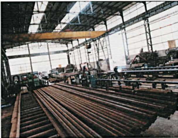
Operazione di taglio presso deposito Merigo S.p.A. Merigo S.p.A. workshop: pipe cutting operation.