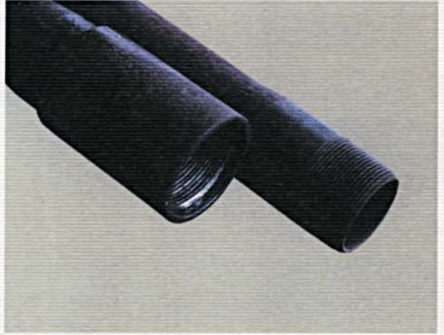
Tubi di pompaggio. Tubing.