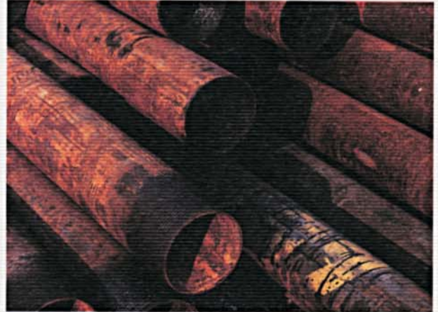
Tubi di rivestimento. Casing.