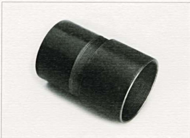
Filetto gas. Gas threading.