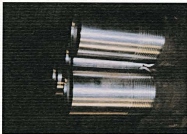
Nippli lunghi. Long nipples.