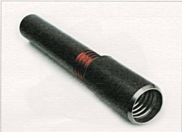
Filetto tondo. Round threading.