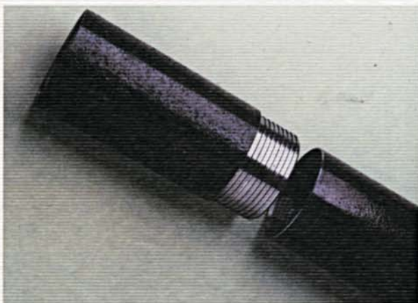
Maschio e femmina. Male/female connection.