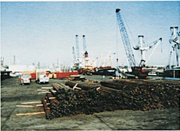
Tubi pronti per l'imbarco. Pipes ready to be shipped.