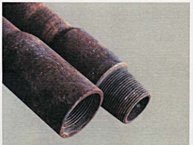
Aste di perforazione. Drill pipe.