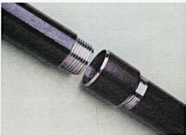
Maschio, manicotto e maschio. Male, coupling, male connection.